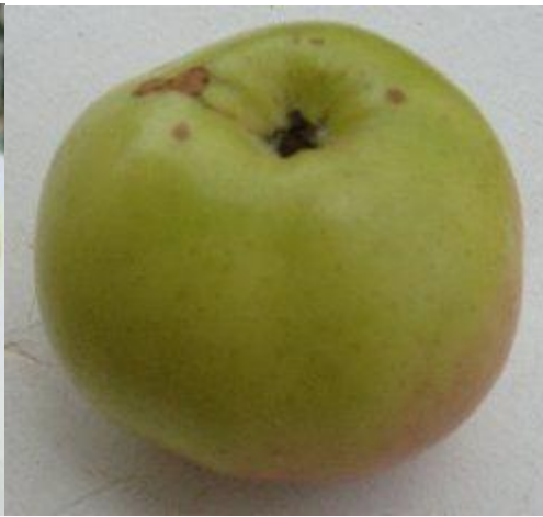
jean-louis © Touraine.